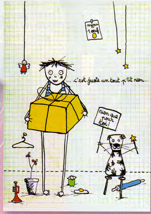
carte « c'est juste un tout p'tit rien »

Où me trouver ? www.filif.fr Le Labo 4, passage du Grand Cerf 75002 Paris www.lelabo.fr 01.40.13.01.58