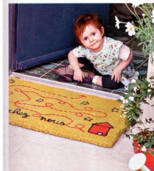
Sur le pas de la porte, une frimousse malicieuse accueille les invités dans sa nouvelle maison. Plantes et pots Truffaut. Tapis « C'est chez nous » de Filf pour DLP.

Sous la table, une simple guirlande de fanions, réalisée avec une toile cirée à carreaux, vient parfaire l'ambiance festive. Lampes à poser Casa. Assiettes métal Fleux. Sets et verres Filf pour DLP. Chaises Tolix.