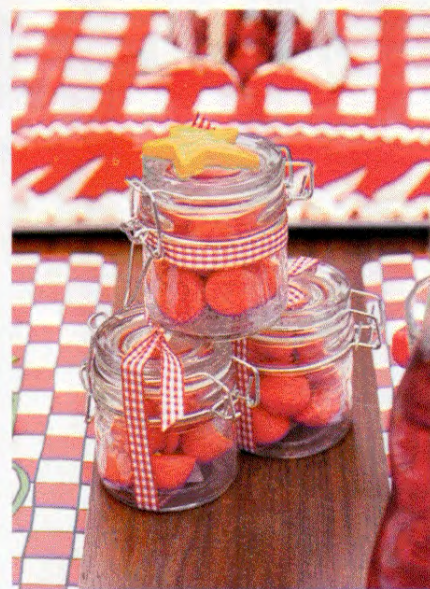
Pyramide de mini-bocaux gourmands, remplis de bonbons, décorés d'un ruban en vichy et surmontés d'une étoile moulée par Filf.